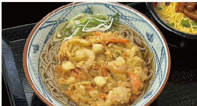
かき揚げそば・うどん (ミニちらし付き)