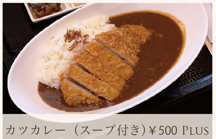
カツカレー (スープ付き) ¥500 PLUS