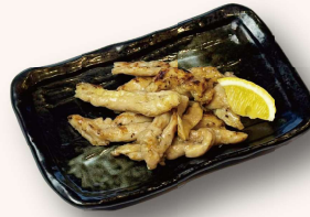
鶏せせり炭火焼き