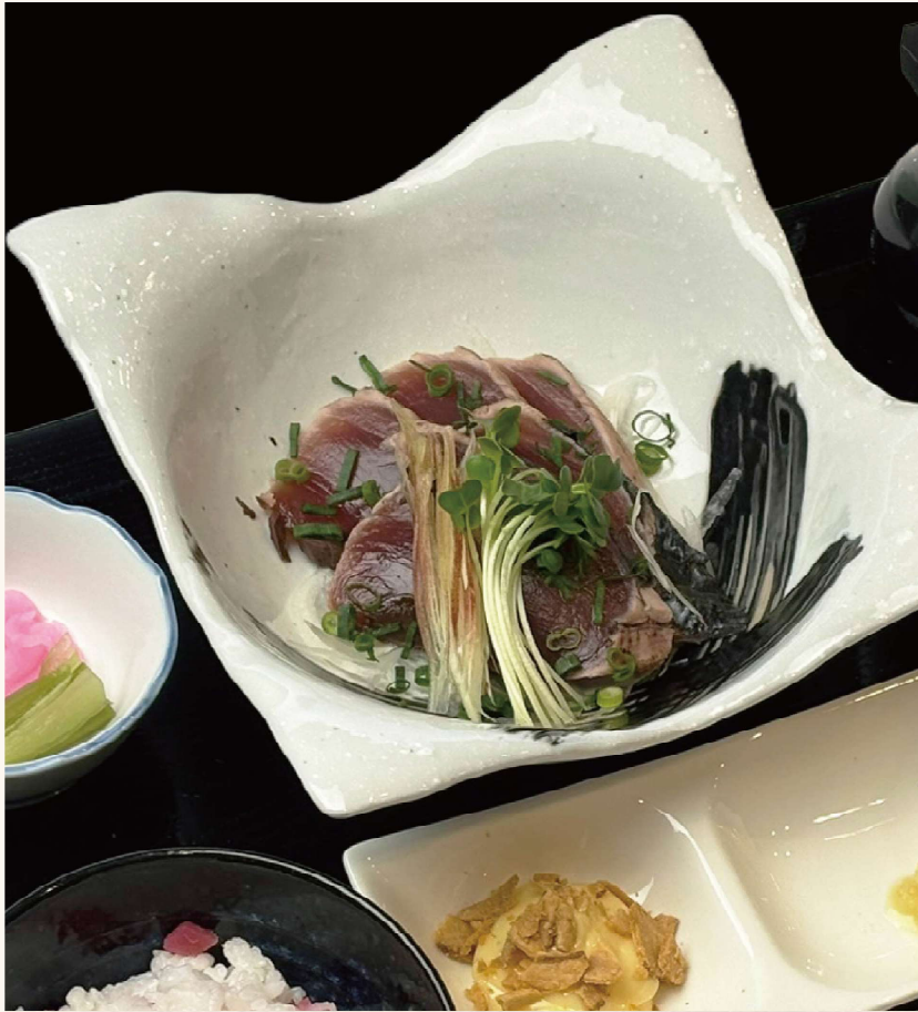
炭焼きカツオのタタキ (梅ご飯・味噌汁・小鉢付き) ¥300 PLUS