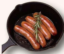
粗挽きソーセージ