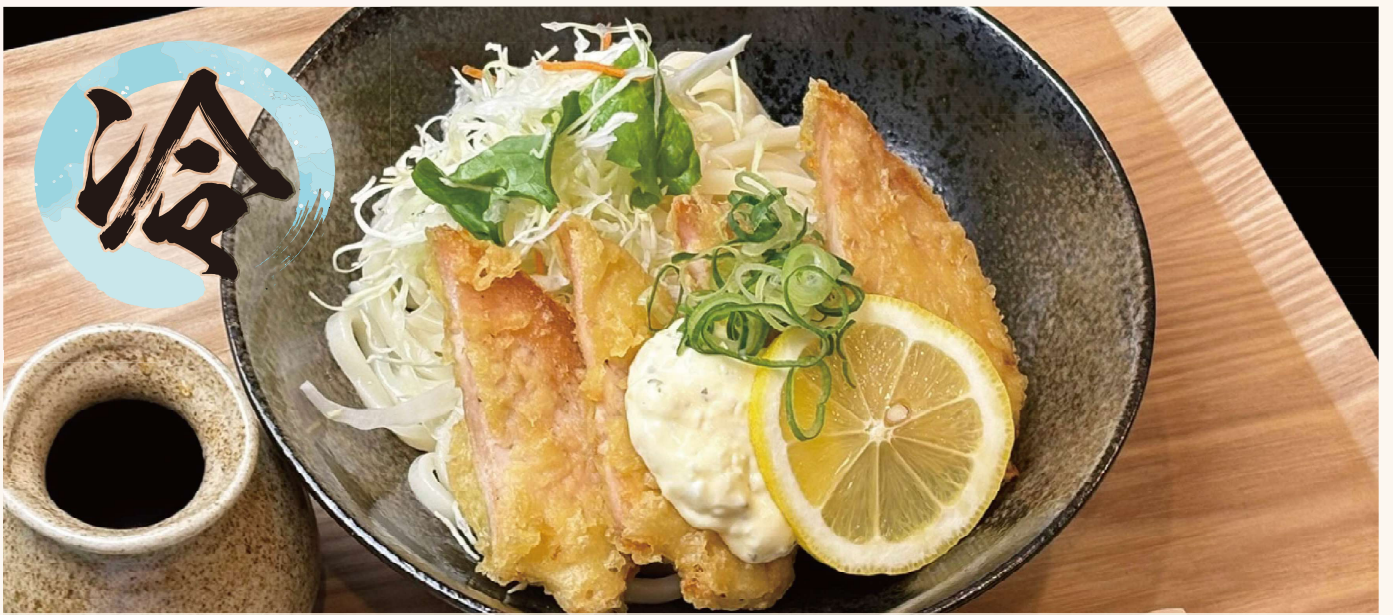
レモンタルタル鶏天うどん