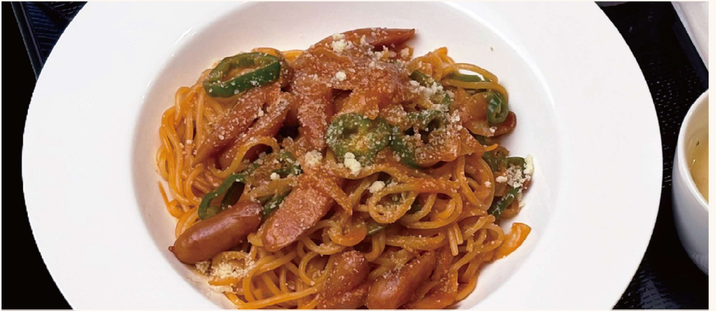
昔ながらのナポリタン (スープ・デザート付き)