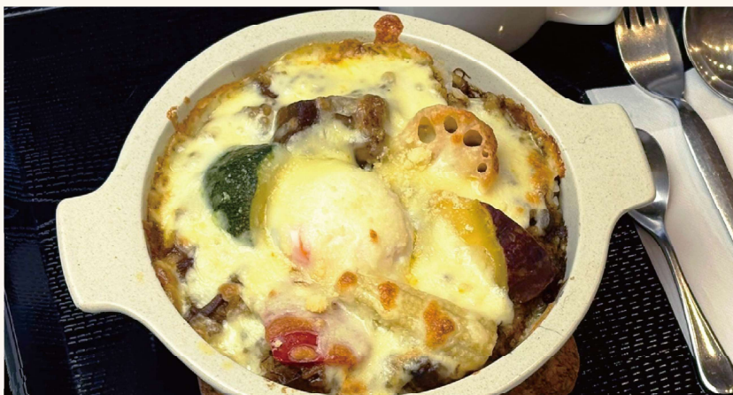
カレードリア (スープ・デザート付き)