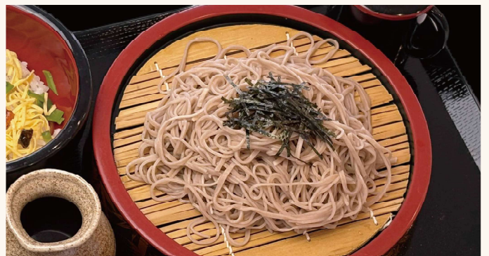
ざるそば (ミニちらし付き)