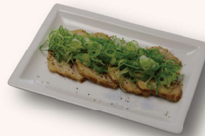
ネギチャーシュー