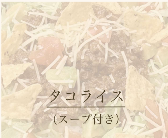
タコライス (スープ付き)