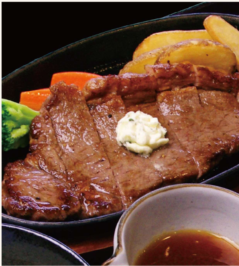
サーロインステーキ