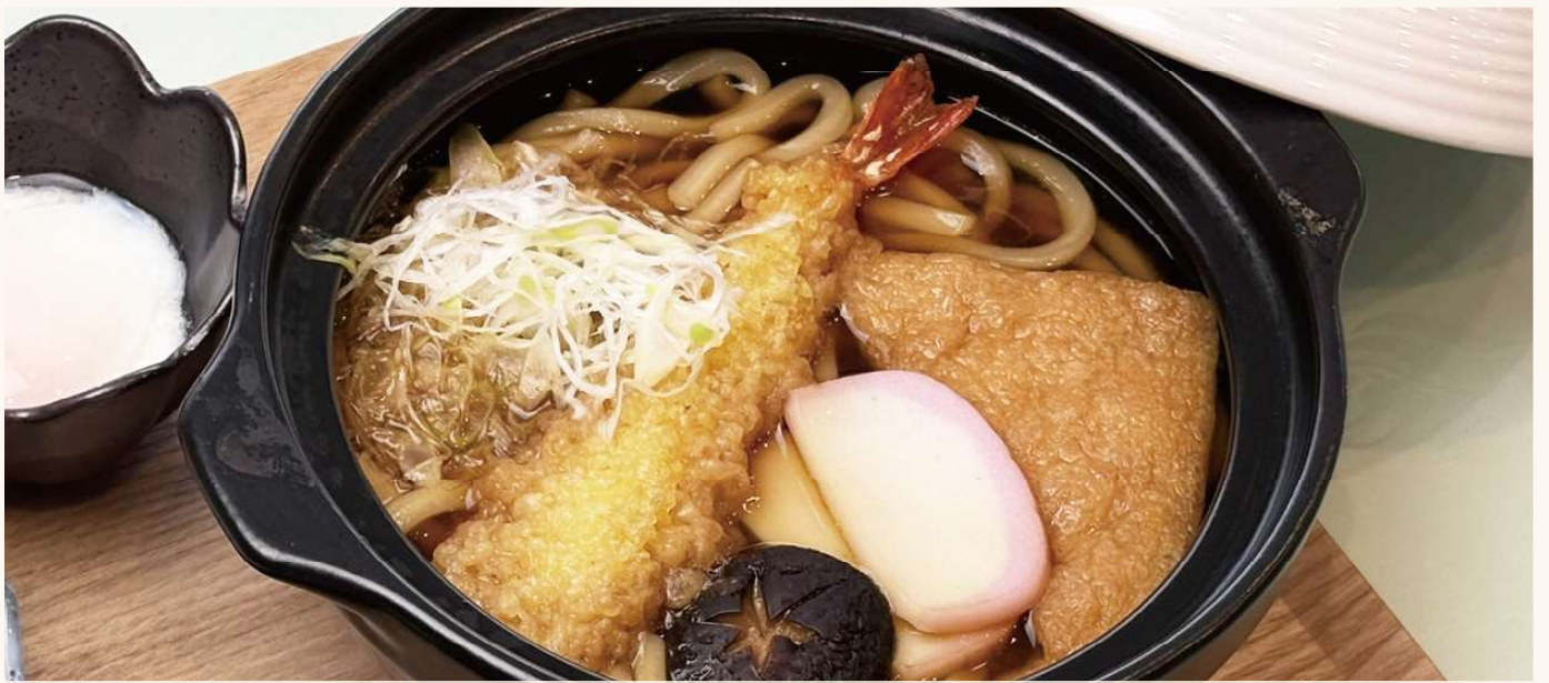
鍋焼きうどん ￥100 PLUS