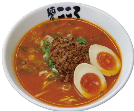
濃厚担々麺 (しゅうまい付き)