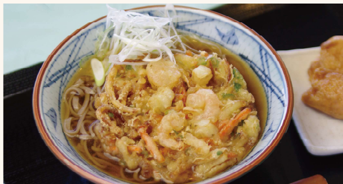
かき揚げそば・うどん (いなり寿し付き)