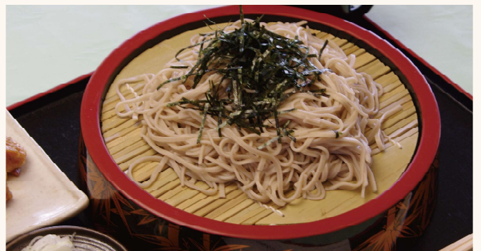
ざるそば (いなり寿し付き)