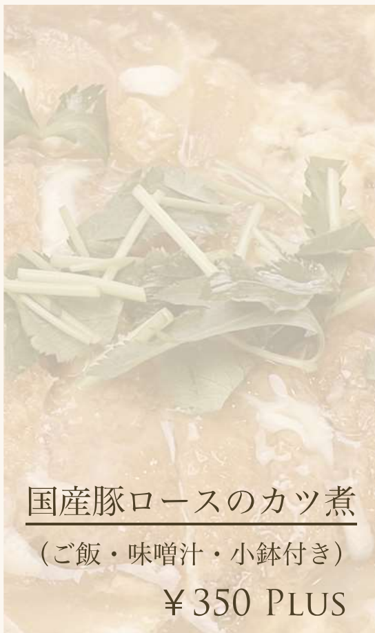
国産豚ロースのカツ煮