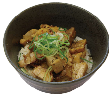
ミニチャーシュー丼 ¥300