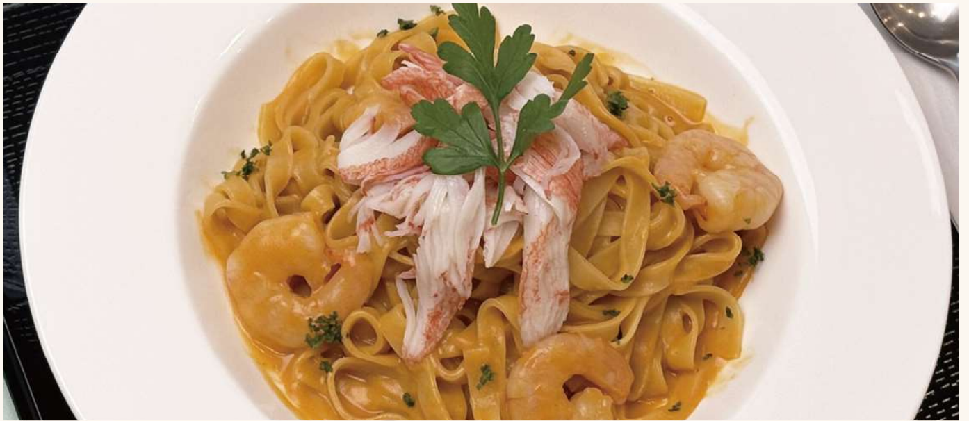
濃厚えびクリームパスタ ￥100 PLUS