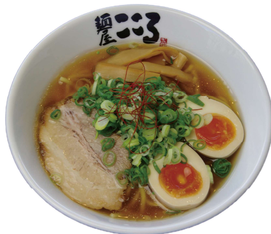
味玉醤油ラーメン (しゅうまい付き)