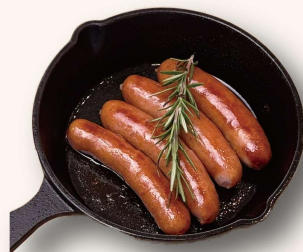
粗挽きソーセージ