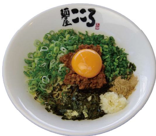
本家台湾まぜそば (追いめし付き)

代表的な具は台湾ミンチ、生の刻んだニラ・ネギ、魚粉、 卵黄、ニンニク。よくかき混ぜて食べる。