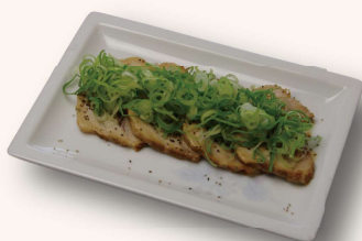
ネギチャーシュー