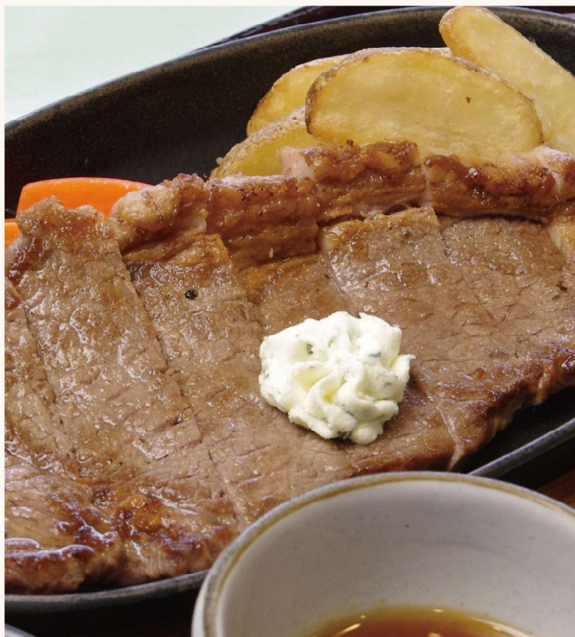
サーロインステーキ